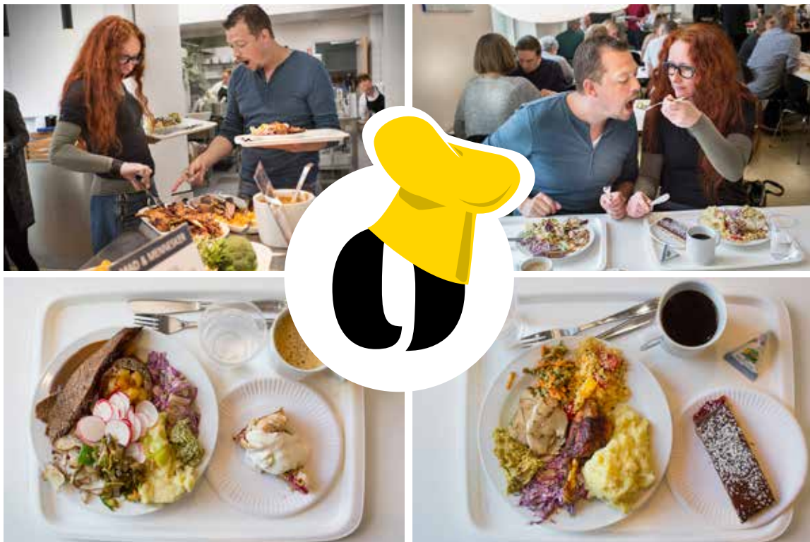
Der var højt humør og glade smagsløg, da to begejstrede grafiske designere kastede sig over Statsbibliotekets kantines buffet. Det var så godt, at selv fotografen måtte hente sig en portion.