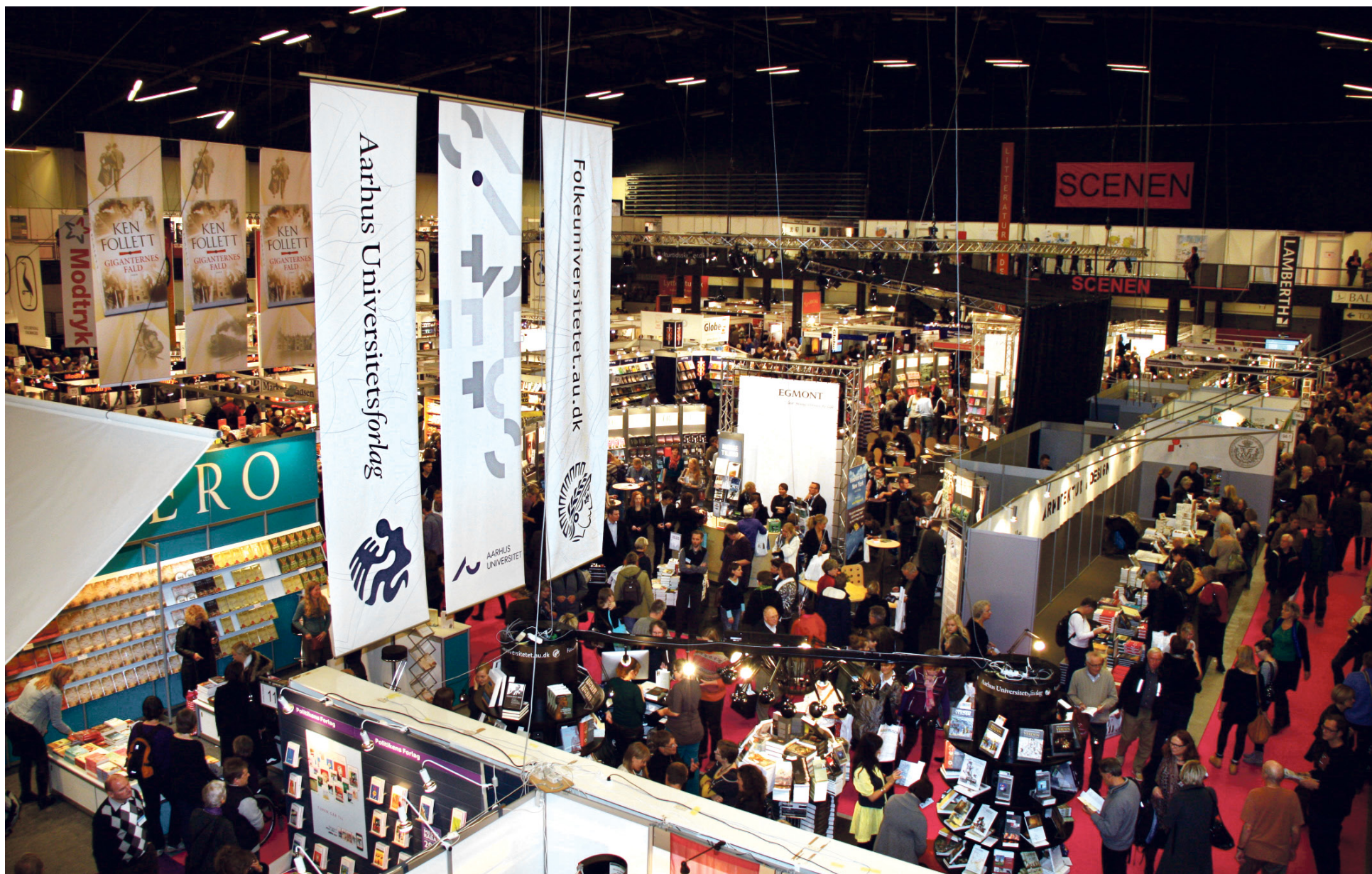
Folkeuniversitetet og Aarhus Universitetsforlag rager op i landskabet på årets BogForum. Interessen var stor for det lille forlags akademiske udgivelser og Folkeuniversitetets kurser.