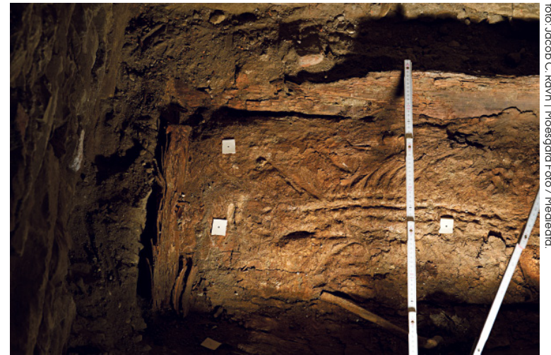
Efter en yderligere udgravning i gravkrypten, hvor Tycho Brahe og konen ligger, fandt tjekkiske arkæologer blandt andet et flot aftryk af Tycho Brahes hustru, hvis kiste var faldet sammen.

– At se Tycho Brahes kones skelet ligge med underbenenes knogler i ret orden, mens resten af skelettet viste sig som et aftryk på kistebunden – det var fantastisk.