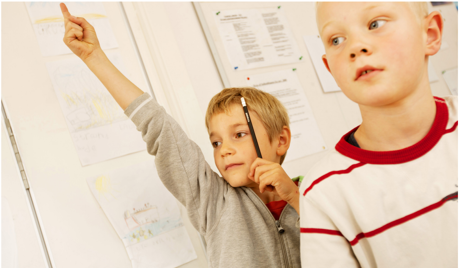
Selvom konkurrencen i mange år har været usynlig og udtalt i skolen er den til stede og skaber bl.a. en kamp om lærerens opmærksomhed.