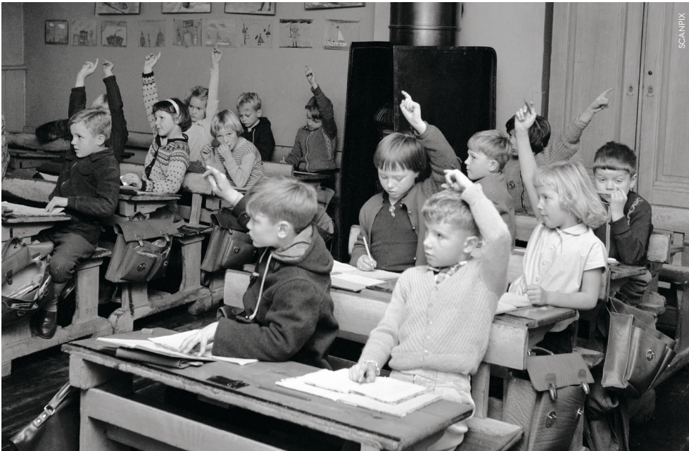
Konkurrence har historisk set vist sig at være den mest effektive måde at motivere elever på. Her ses ivrige elever, der rækker hånden op på Valby Skole i 1958