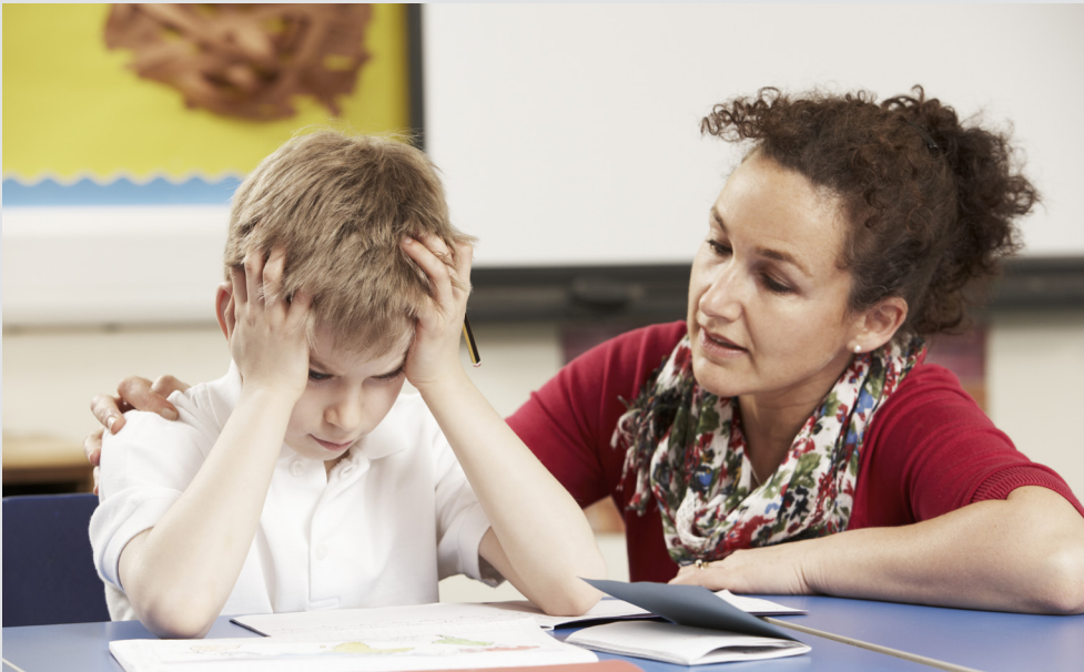
Elevens grad af selvkontrol og elevens interesse for at sætte mål er lavere for de elever, som modtager støtte end for lavtpræsterende elever uden støtte. Det viser en ny undersøgelse fra DPU, Aarhus Universitet.

Det er den enkelte skoleleder, der afgør, hvilke elever der kan få støtte. Oftest træffer skolelederen beslutningen i samråd med skolens egne vejledere og med kommunens Pædagogisk Psykologiske Rådgivning (PPR). Afgørelsen om tildeling af støtte og støtts omfang og karakter baserer sig på resultaterne fra test – bl.a. de nationale test. Men i de fleste tilfælde indgår også lærernes og forældrenes vurdering, så overordnet set er der tale om relativt subjektive skøn.