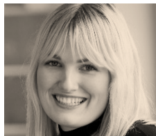
Ditte Højland Bioteknologi

Jeg har fået en enestående mulighed for at prøve kræfter med iværksætteri. Det har givet mig et helt nyt perspektiv på, hvordan jeg kan omsætte mine faglige interesser til idé- og produktudvikling i kommerciel sammenhæng.