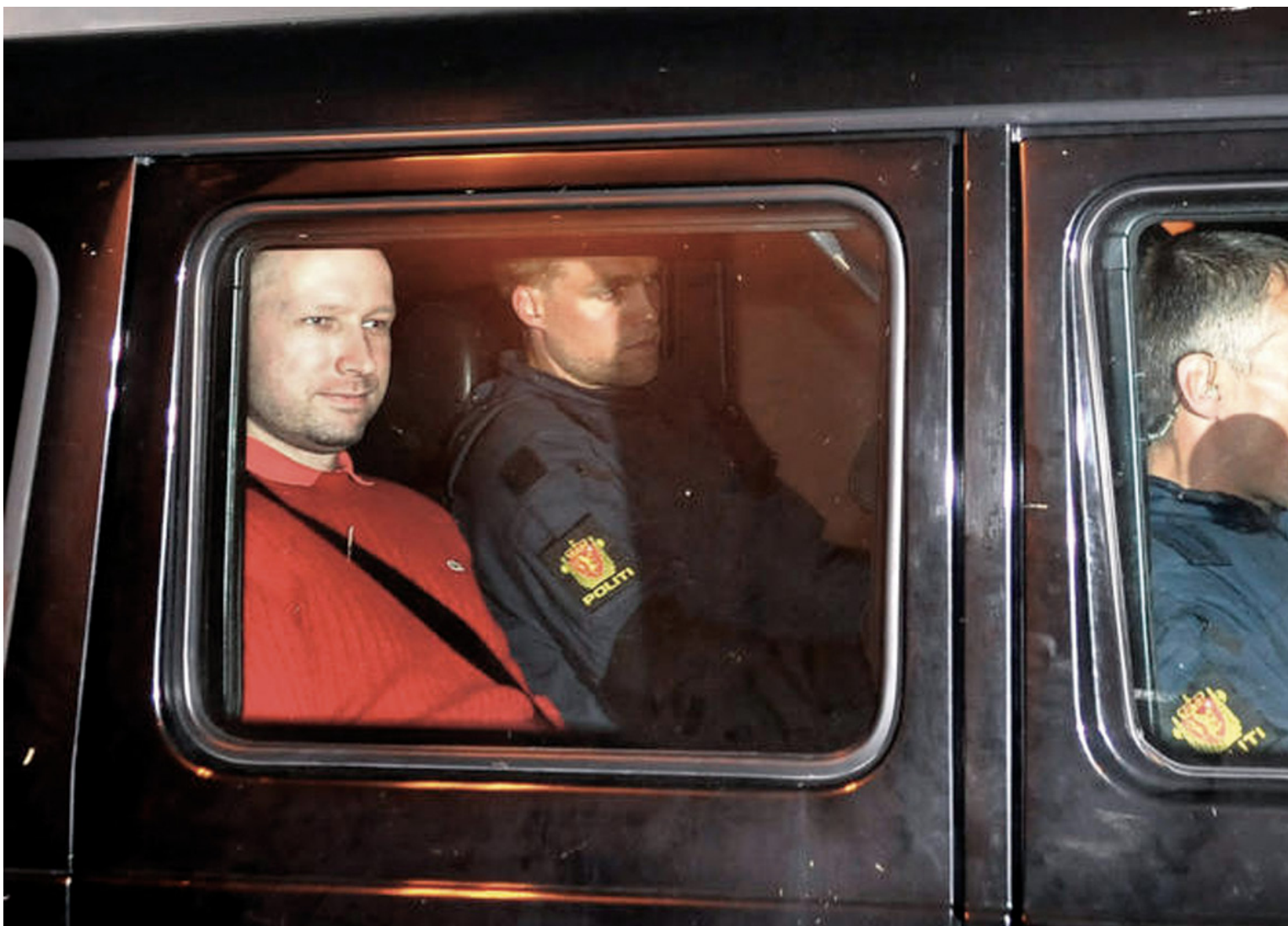
Anders Breivik fotografert i bilen på vej til retsalen i Norge. Den norske masse-morders ideologiske ståsted – og om man i det hele taget kan sige, at han har en ideologi – blev diskuteret på en konference på Aarhus Universitet.