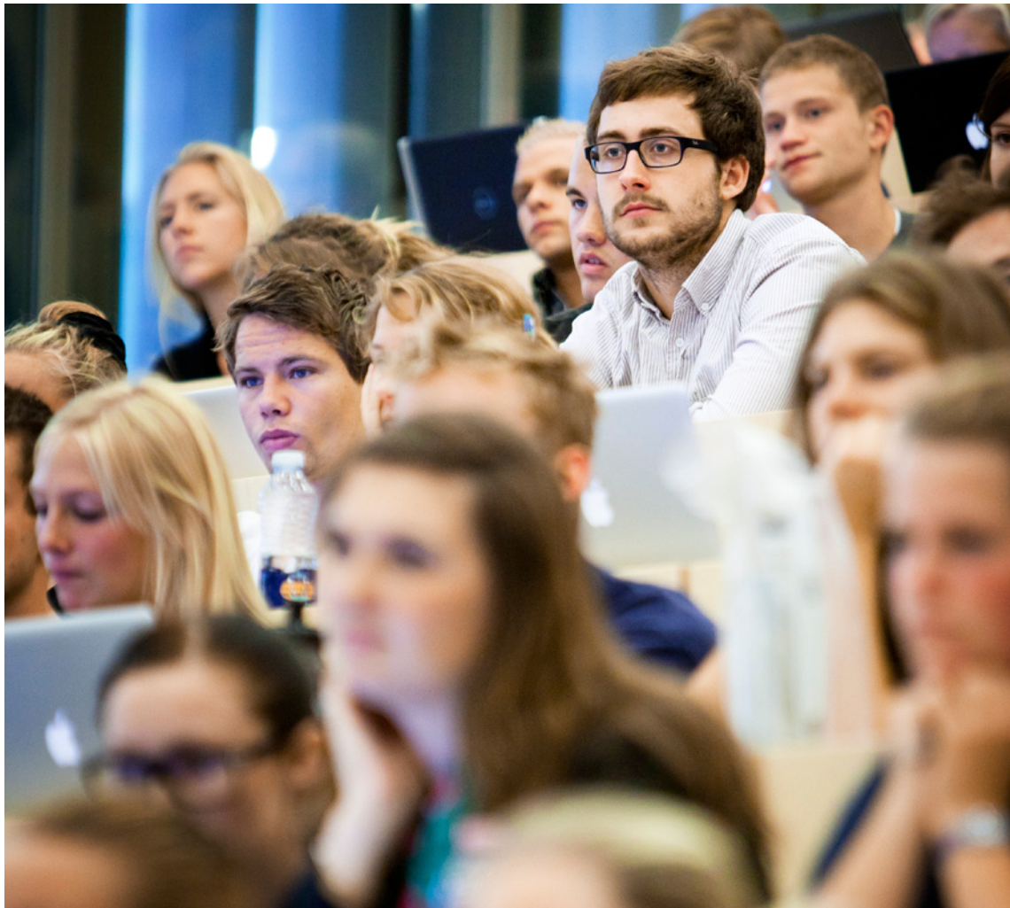
Undervisningen på universiteterne mister sammenhæng med forskningen på mange områder, fordi flere og flere af universiteternes egne penge til fri forskning bliver brugt til forskning, der kan tiltrække eksterne forskningsbevillinger.

På grund af for lave taxameter-takster for beståede eksamener mangler universiteterne ifølge egne opgørelser årligt 1,2 milliarder kroner for at finansiere deres uddannelser. Det beløb tages fra