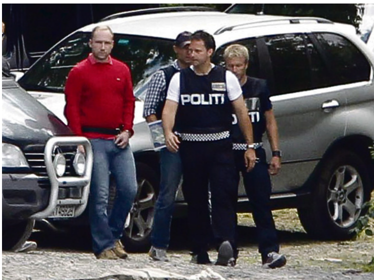
The mind of the mass murderer Anders Breivik has been discussed at a AU conference.