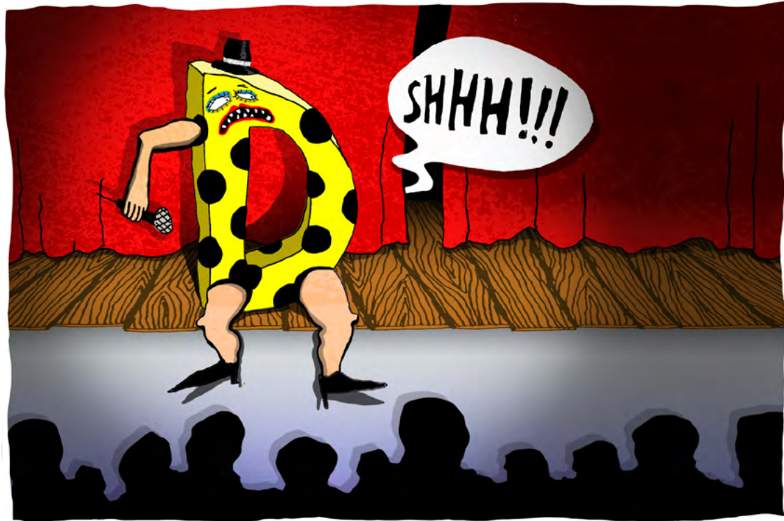
Illustration: Louise Thorne-Jensen

– Der er gode grunde til, at skriftsproget ikke ændrer sig. Skriftsproget er en konvention, man lærer i skolen. Hvis man skulle ændre skriftsproget i takt med talesproget, ville man give afkald på den sproglige kontinuitet. Man ville miste den fælles sproglige referenceramme. Derfor er skriftsproget mere konservativt end talesproget. Det danske talesprog ændrer sig meget hurtigt. Det kan man se, hvis man sammenligner med de andre lande i Norden. Dansk har ændret sig meget mere