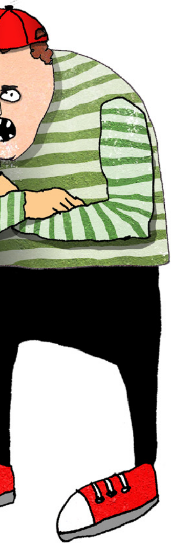
Illustrationer: Louise Thraane-Jensen

pres, der hviler på dem, mener Ansa Lønstrup.