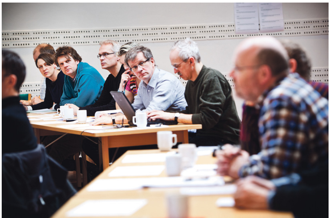
Hvordan kan forskning, rådgivning, undervisning og økonomi komme til at hænge sammen på Institut for Bioscience? Personaleledere og faggruppeledere søgte svaret i Mols Bjerge.

– I Aarhus er det den faglige interesse alene, der får os til at indgå i projekter, mens det i det gamle DMU også er økonomien, der motiverer, forklarer personaleleder