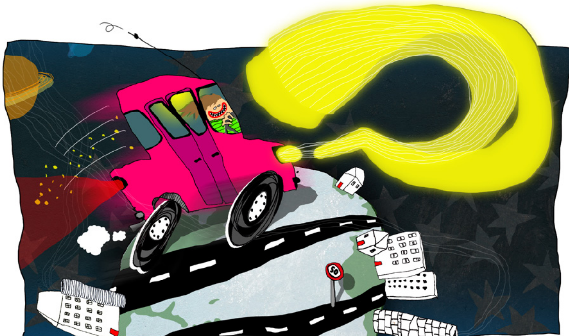
Illustration: Louise Thorne Jensen

– Hvis det rent faktisk kunne lade sig gøre at køre i en bil med lysets hastighed gennem luft, ville den kunne bevæge sig otte gange rundt om jorden i sekundet. Hvis en tilskuer kunne nå at opfatte bilen med øjet, ville man kunne se, at bilen i sig selv lyste. Den ville begynde at udskille partikler, der ville få den til