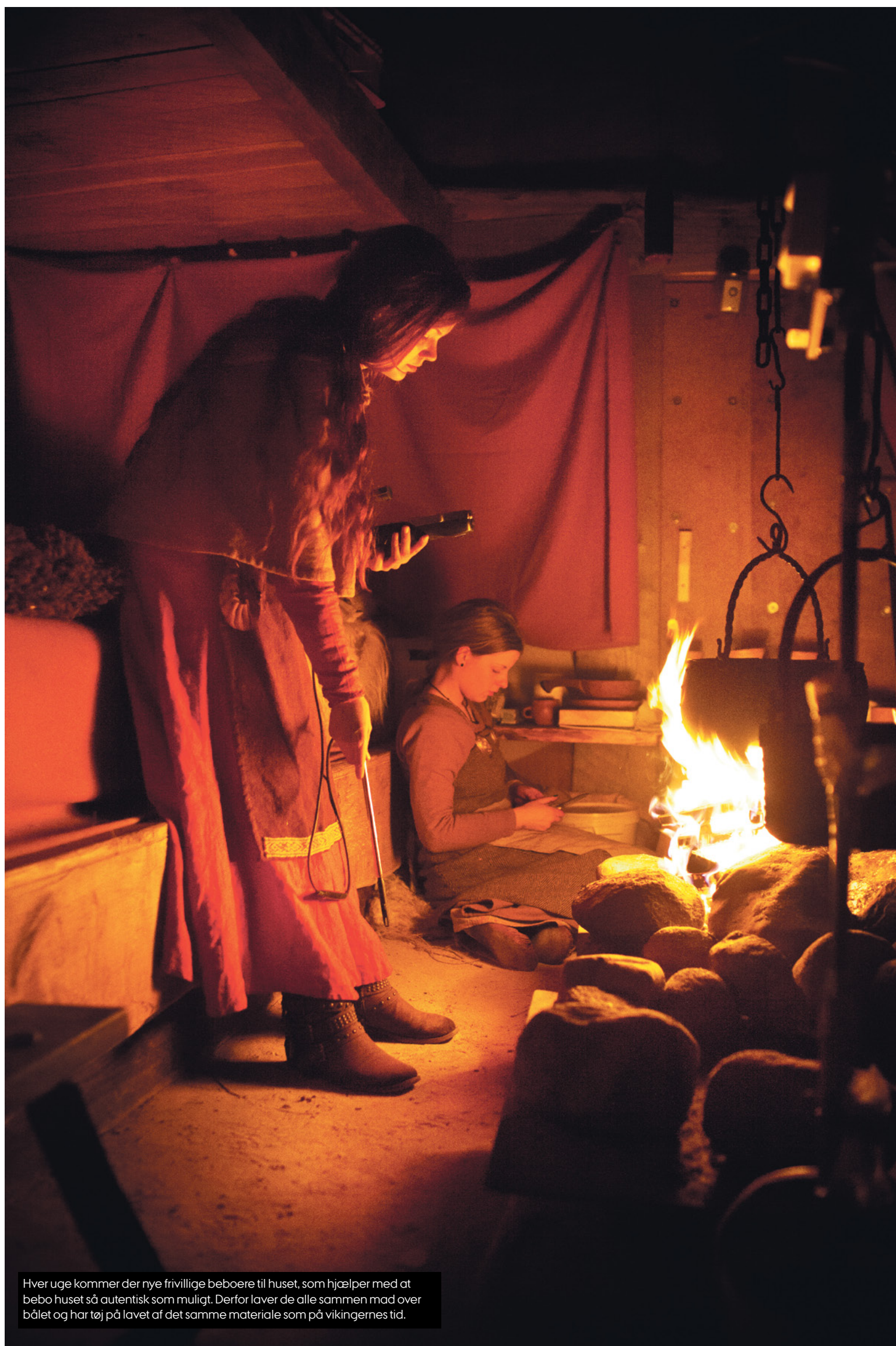
Hver uge kommer der nye frivillige beboere til huset, som hjælper med at bebo huset så autentisk som muligt. Derfor laver de alle sammen mad over bålet og har tøj på lavet af det samme materiale som på vikingernes tid.

– I mange tredjeverdenslande bor man i nogenlunde samme type hytter. Og så kan forsøg som det her bruges til at vise, hvor det er bedst, der er en skorsten. Vi