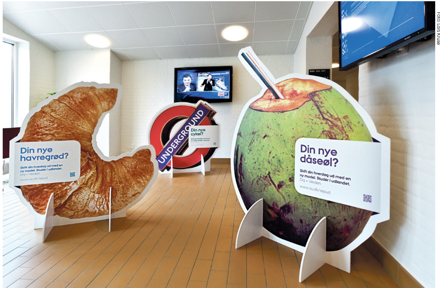
Er det i orden at lokke studerende til at undersøge muligheden for et udlandsophold via meterhøje papfigurer med kække budskaber? Problematisk og fordummende, siger to studerende.

Vi må gå ud fra, at der ligger reelle overvejelser bag enhver kampagne og ethvert nummer af UNivers . Vi kan dog ikke genkende det billede af studerende, der afspejles i kampagnerne. At de studerende skulle rejse til Hawaii for at drikke af kokosnødder