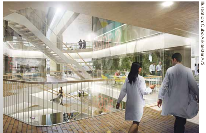
Illustration: Cubu Arkitekter A/S

To nye parallelle bygninger, der skal huse fremtidens biomedicinske forskning, og en markant ændret facade med glasparti ud mod parken på den eksisterende Bartholin Bygning. Det er vinderforslaget fra Cubu Arkitekter A/S i Bygningsstyrelsen og Aarhus Universitets projektkonkurrence om udvidelse og renovering af Institut for Biomedicins forsknings- og undervisningsfaciliteter – et projekt til i alt 644 millioner kroner. Forslaget blev offentliggjort den 6. juni, og man kan se flere billeder af det nye byggeri på health.au.dk/aktuelt/byggeri