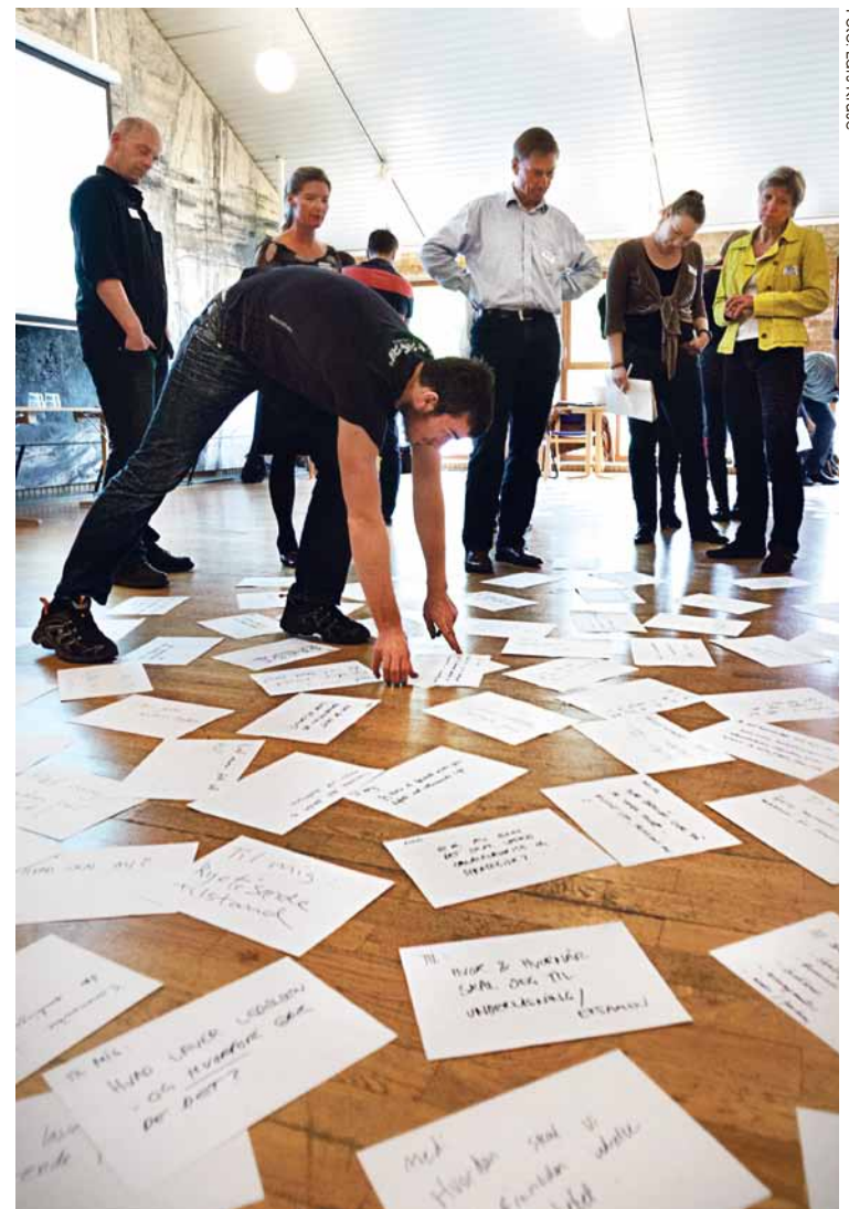
Omkring 50 ansatte og studerende var den 10. maj indbudt til inspirationsdag, og input herfra er med til at danne baggrund for den indstilling, der nu er sendt i åben høring.

For at et nyt AU-medie skal lykkes, er der en række andre forudsæt-