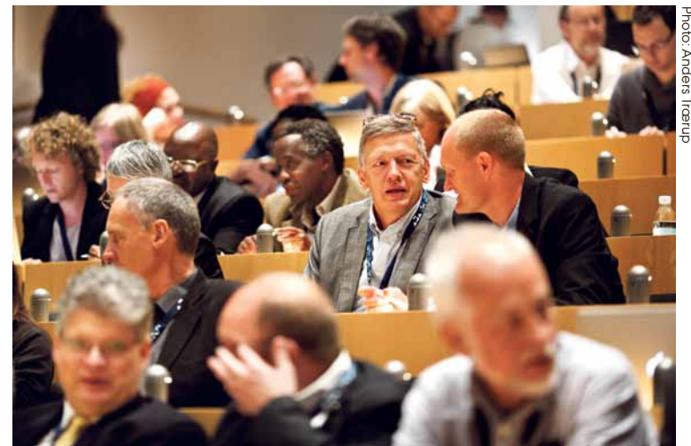
The members of the SANORD University Network met at Aarhus University to work on the network's objectives.

He explains that the SANORD partnership originated in the historical links between the Nordic countries and Southern African