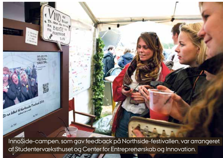
InnoSide-campen, som gav feedback på Northside-festivalen, var arrangeret af Studentervæksthuset og Center for Entreprenørskab og Innovation.

Mere end 500 gæster benyttede sig i løbet af weekenden af InnoSide-teltets mulighed for at give NorthSide Festival feedback på deres arrangement, men derudover var teltet også en mulighed for at høre