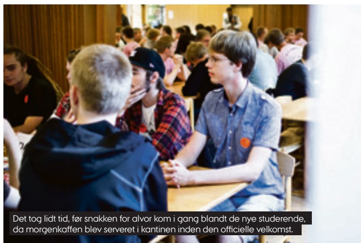
Det tog lidt tid, før snakken for alvor kom i gang blandt de nye studerende, da morgenkaffen blev serveret i kantinen inden den officielle velkomst.

– Jeg glæder mig meget til at lære mere om det fag. Jeg interesserer mig for matematik og computere, og hvordan vi kan bruge logikken til at løse opgaver og