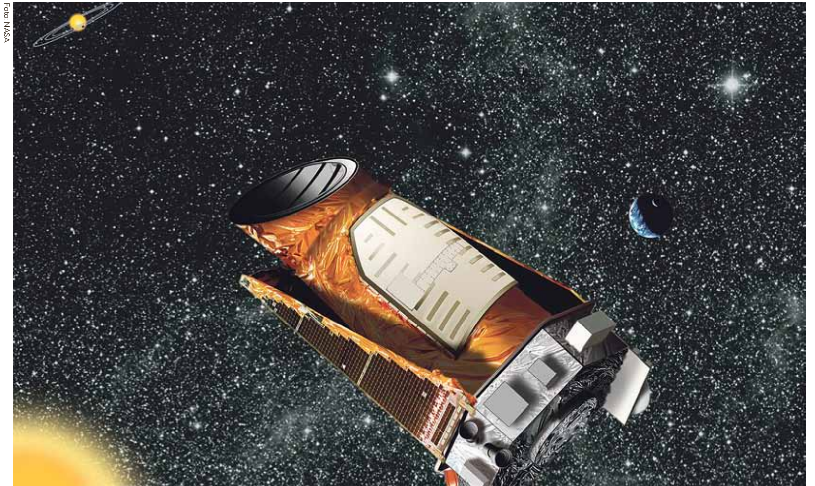
Kepler-satellitten, der vejer omkring et ton, blev sendt i kredsløb om solen i marts 2009. Den flytter sig hele tiden længere væk fra solen og befinder sig nu ca. 15 millioner kilometer væk. Det er ca. 50 gange længere væk end månen. Satellittens signaler indfanges af kæmpeantenner i USA og sendes videre til Aarhus Universitet, hvor astronomer analyserer data.

Han er samtidig overbevist om, at forskerne igen bliver overraskede over naturens indretning. Deres ideer om universet bygger på deres forståelse af fysikken, men når videnskabsfolkene ser nye områder af verdensrummet, finder de ting, de slet ikke havde forestillet sig.